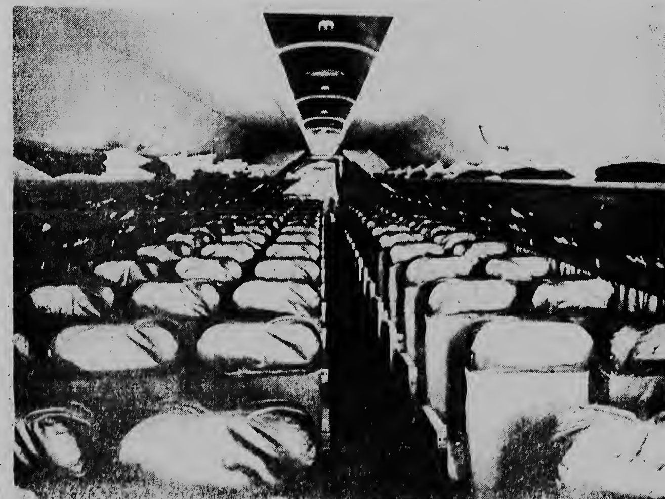
Un bista dje interior di e DC-6B di Trans Caribbean. Por cierto e sientonan ta un poco riba otro, pero sigur den bon man y nan ta luci comodo.

ORANJESTAD — Di acuerdo cu e principio di „esun cu risca lo gana“ e compania Trans Caribbean Airways ta considerando seriamente di awor caba pa cumpra algun avion di reaccion y cu diferente fabricanan di avionnan na Es-